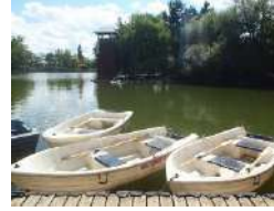
Lac du soler